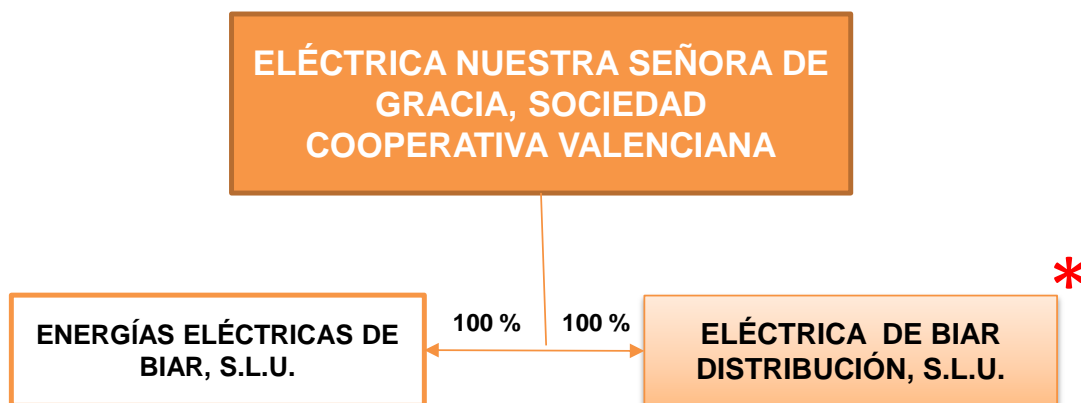
Gráfico 1: Estructura societaria de COOP. NTRA. SRA. GRACIA a 31/12/2015