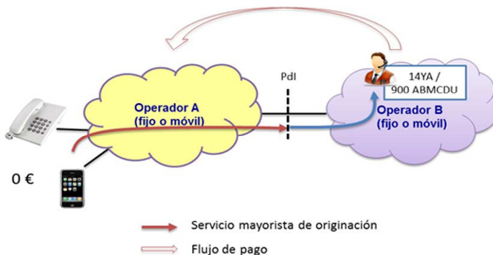
Gráfico 1: Esquema del servicio de originación mayorista para números gratuitos para el llamante.

El servicio mayorista de originación permite que los clientes de los operadores fijos y móviles puedan acceder a los servicios gratuitos para el llamante que ofrece el operador interconectado o los prestadores de servicio conectados al mismo. La figura siguiente describe el servicio y muestra el flujo de pagos asociados al mismo: