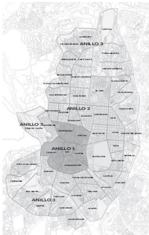
Gráfico 1. Alcance de la nueva moratoria