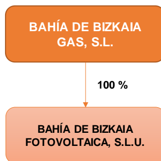
Gráfico 2: Socio único de BAHÍA DE BIZKAIA FOTOVOLTAICA, S.L.U. a 07/06/2019