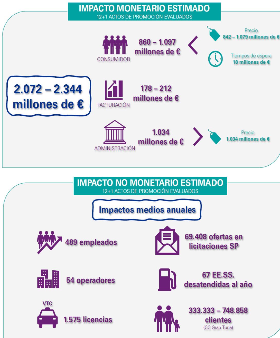
Diagrama 2: impacto monetario estimado para los doce casos de estudio