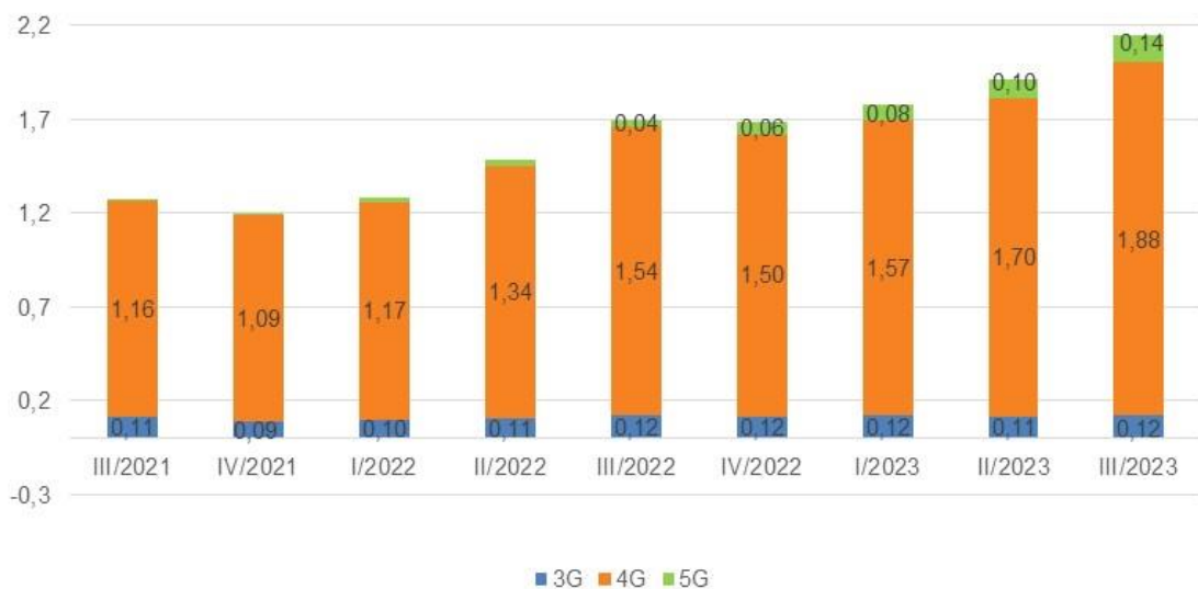
Evolución de tráfico de banda ancha móvil (millones de Terabytes).

El tráfico de banda ancha móvil registró 2,1 millones de Terabytes, un 26,3 % más que en el mismo periodo del año anterior.